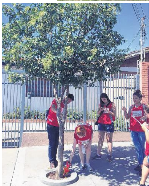
Estudantes focam árvores da cidade para identificar características e traçar cuidados