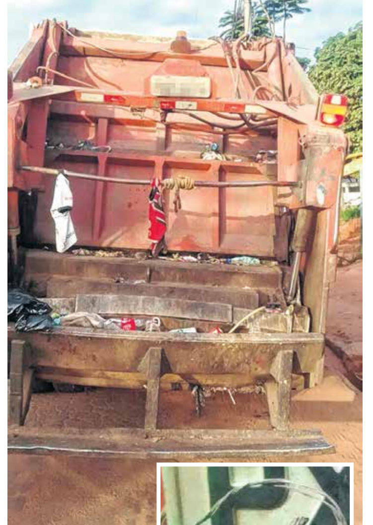
Caçamba do veículo se encontra em péssimo estado; até placa está amarrada com um arame