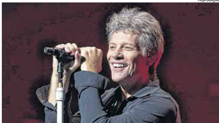
Jon Bon Jovi é líder da banda americana que leva seu nome

O Rock in Rio, iniciado no dia 15 e com término em 24/9, prossegue hoje com as seguintes atrações no Palco Mundo: Jota Quest às 19h; Alter Bridge (grupo de metal dos EUA) às 21h; Tears for Fears (banda britânica de new wave, com grandes hits desde 1981, capitaneada por Roland Orzabal e Curt Smith, às 22h35) e, enfim, por volta de 0h30 já de sábado, Bon Jovi (grupo norte-americano que, desde 1982, coleciona sucessos).