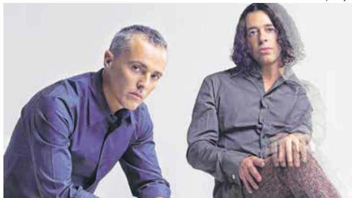
Roland Orzabal e Curt Smith formam o Tears for Fears

Também nesta sexta-feira, já no palco Sunset, uma atração que promete é Ney Matogrosso e Nação Zumbi.