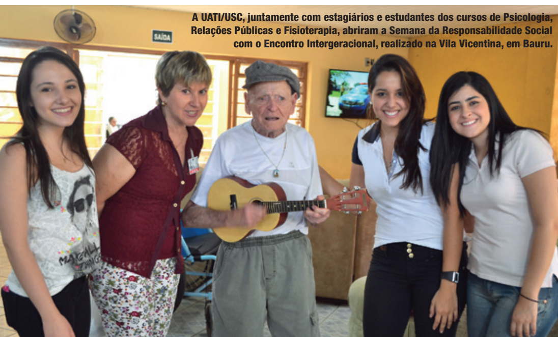
A UATI/USC, juntamente com estagiários e estudantes dos cursos de Psicologia, Relações Públicas e Fisioterapia, abriram a Semana da Responsabilidade Social com o Encontro Intergeracional, realizado na Vila Vicentina, em Bauru.

USC participou, em setembro, da Campanha da Responsabilidade Social do Ensino Superior