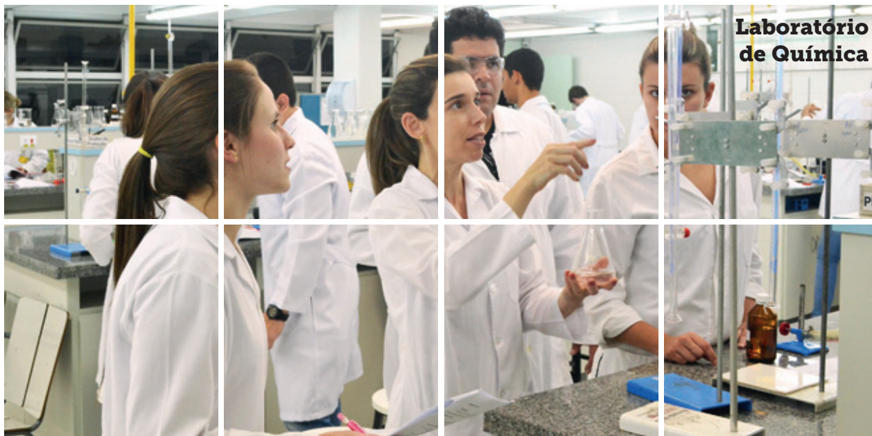
Laboratório de Química