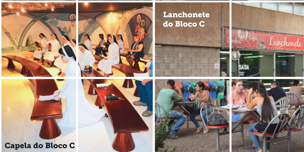
Lanchonete do Bloco C