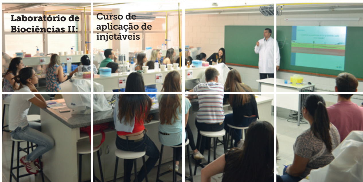
Laboratório de Biociências II: