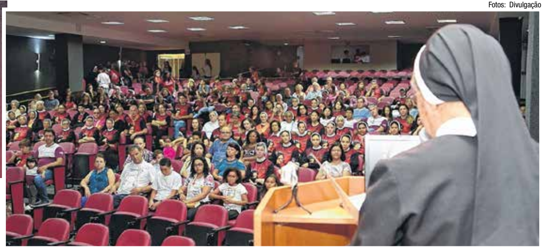
A concentração em Bauru foi iniciada às 22h30 de anteontem com um momento de acolhida

Em 1900, as primeiras apóstolas chegaram ao Brasil e, em 1902, nos EUA. Madre Clélia morreu em Roma no dia 21 de novembro de 1930. O IASCJ, com sede também em Roma, está presente em 15 países, nos continentes europeu, americano, asiático e africano, com atuação nas áreas da educação, saúde, missões e promoção humana e espiritual.