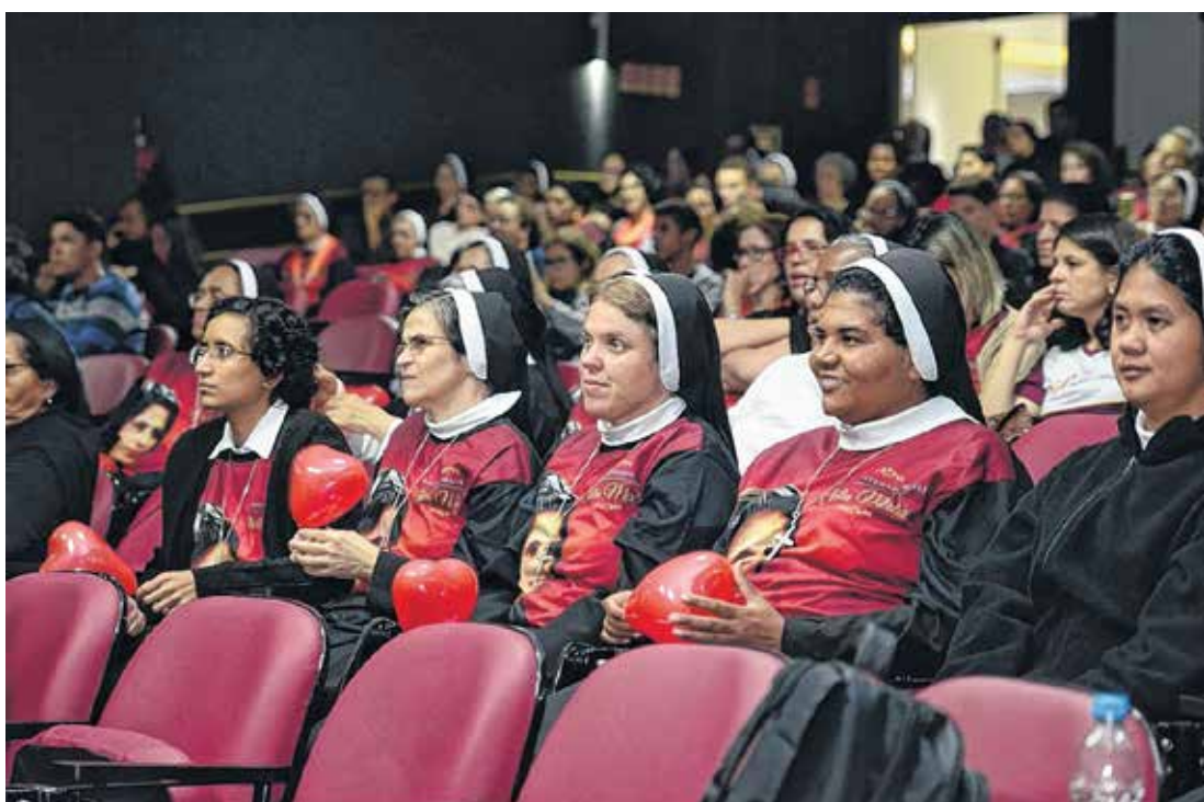
Discípulas reunidas em Bauru, durante beatificação de Madre Clélia, a fundadora do IASCJ