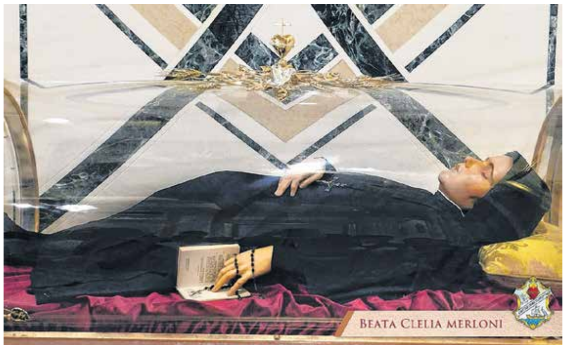
Urna de vidro onde fiéis de Madre Clélia podem reverenciá-la, na capela da Casa Geral, em Roma