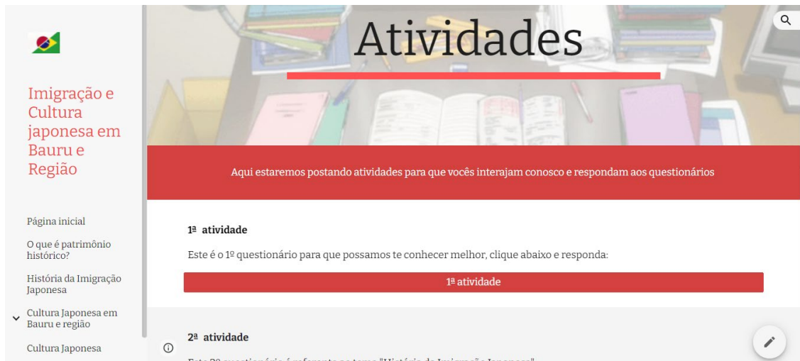
Figura 2 – Imagem da aba de atividades do site criado para o projeto