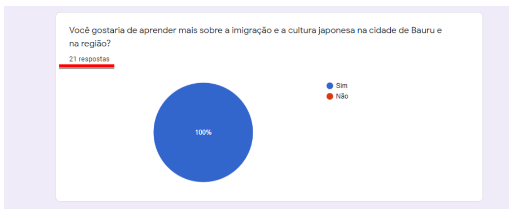
Figura 1 – Resposta dos alunos no questionário diagnóstico com destaque no número de respostas

Como produto final do presente projeto será realizado presencialmente, no mês de dezembro, uma oficina de construção de um mangá – um desenho de estilo japonês –, no qual cada aluno irá, por meio do desenho, relatar sua experiência no projeto e seu aprendizado sobre os patrimônios históricos e a conexão com a história da imigração japonesa.