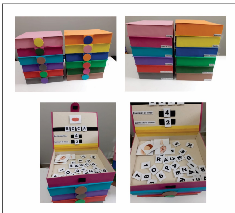
Figura 1: Jogo

O desenvolvimento das atividades no Projeto de Residência Pedagógica ocorreu a partir do contato com a professora preceptora, alinhamos as atividades que seriam desenvolvidas e além de assistirmos às aulas do Centro de Mídias de São Paulo ela propôs que produzíssemos jogos voltados às disciplinas de português e matemática para auxiliar nos reforços dos alunos com maiores dificuldades. Fiquei responsável por desenvolver algum jogo na área de Língua Portuguesa e com o apoio da professora preceptora e de pesquisas produzi, em minha casa, 12 caixas com palavras de vários campos semânticos acompanhadas por figuras, separadas letras por letras, com velcro colado atrás de cada peça, na tampa da caixa possui a outra parte do velcro e o aluno poderá escolher a figura que quiser e montar a palavra relacionada. Também, colocará a quantidade de sílabas e letras que cada palavra apresenta. (Vide Figura 1).